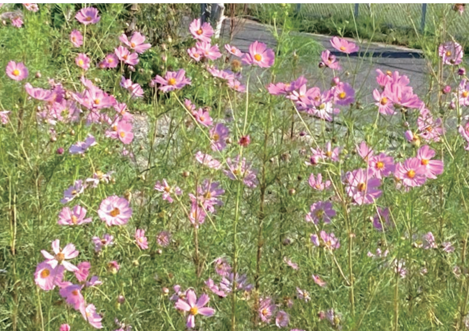
秋風に揺れるコスモス 和名は秋桜(あきざくら)